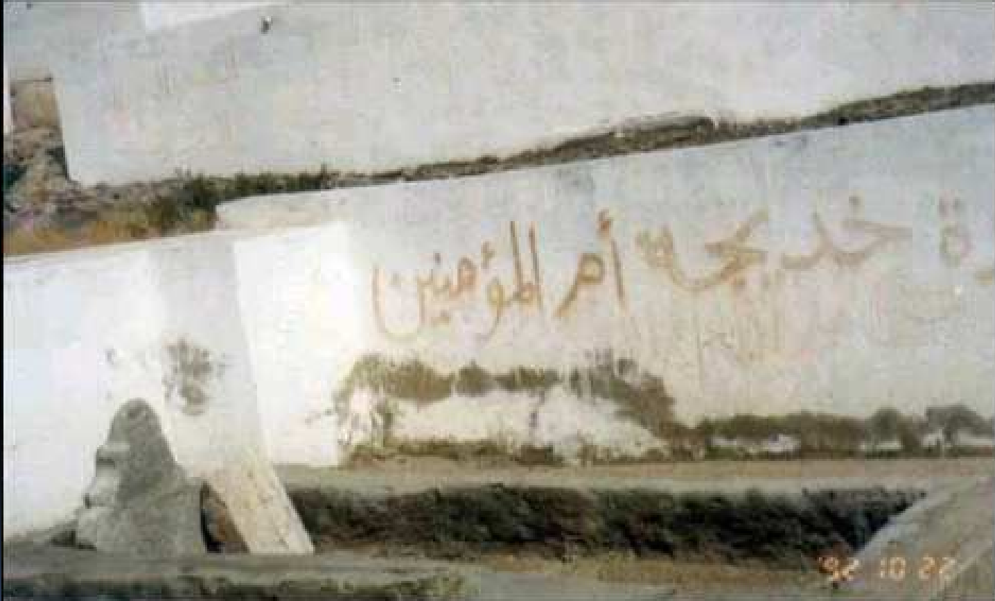
QABR-E-BIBI KHATIZA UMMUL MOAMINEEN MACCA